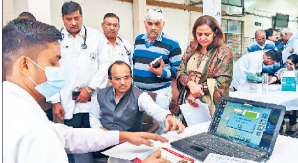
भिवानी। शिविर में स्वास्थ्य की जांच करवाते हुए।