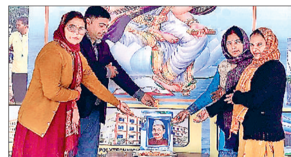
महेन्द्रगढ़। डॉ. राजेंद्र प्रसाद के चित्र पर पुष्पापिठ करते हुए।

प्रारंभिक पूछताछ में चुनावी रंजिश का मामला सामने आया है। आरोपितों को न्यायालय में पेश कर पुलिस रिमांड पर लिया जाएगा। रिमांड के दौरान आरोपितों से गहनता से पूछताछ की जाएगी।