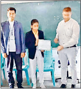
महेन्द्रगढ़। छात्रा का सम्मानित करते हुए।