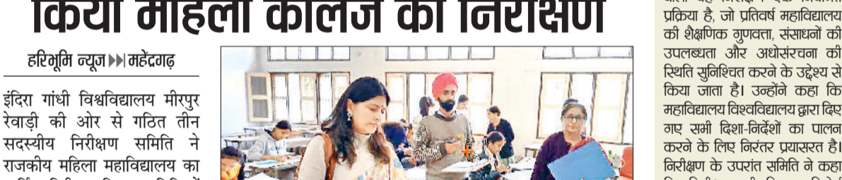
महेन्द्रगढ़। महाविद्यालय का निरीक्षण करते टीम सदस्य।