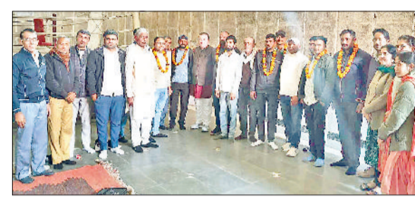
महेन्द्रगढ़। बैठक करने के बाद उपस्थित कर्मचारी।